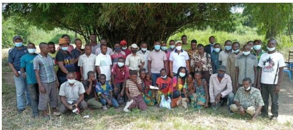
Associatie van het eiland Mbiye.

Door onderwijs en uitwisseling van plaatselijke kennis en ervaring op de velden van de scholen, maar ook op de velden van de leden van de associaties, zullen wij de agronomische methoden