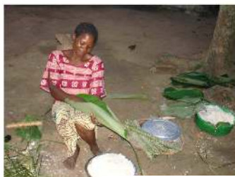
Verwerking van de besenpa